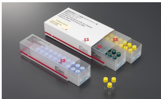
图 1 包装外观